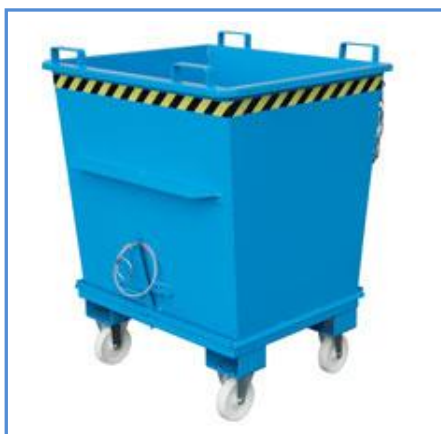
Bodemklepcontainer met wielen (optie)