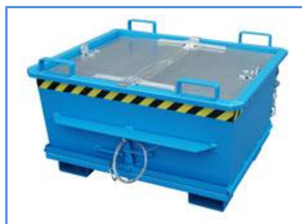
Bodemklepcontainer met deksel (optie)