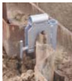
HOUDER voor damplanken :

-Breedte = 0,20m -Hoogte = 0,24m -Uitschuifbaar vanaf 0,01m tot 0,05m -Materiaal = Staal -Oppervlakte = Verzinkt -Gewicht = 2,50kg