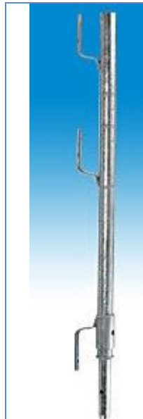
Leuninghouder Type 1 :

Lengte = 1,20m Materiaal : Staal Oppervlakte = Verzinkt Gewicht = 4,60kg