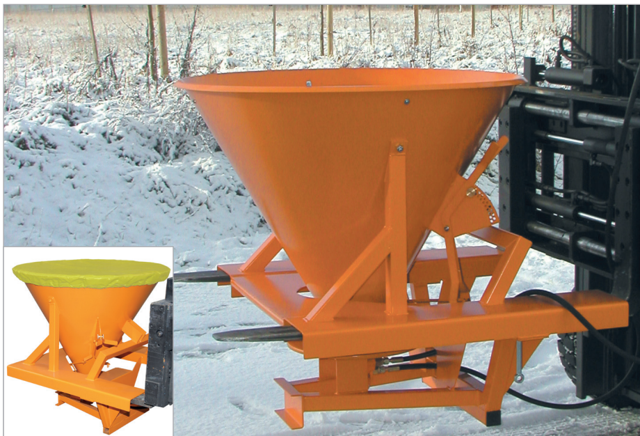
SH met afdekzeil