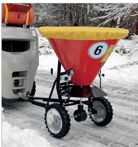
STW 100 met afdekzeil