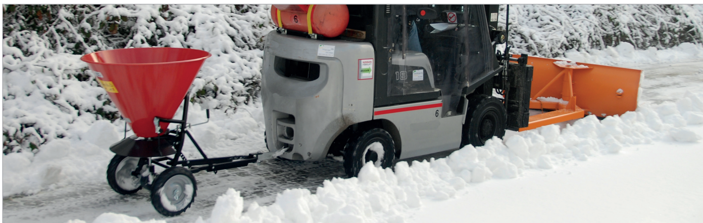
Sneeuwschuiver SCH-G in combinatie met STW 100